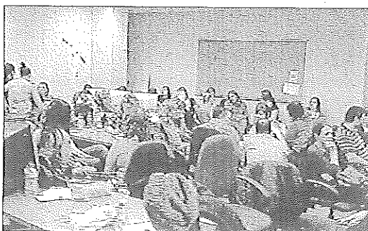
Trabajadores de Sykes en una sala durante la jornada laboral.

Los sindicatos denuncian que la empresa recluye a 80 trabajadores en salas sin carga de trabajo para que abandonen su puesto por aburrimiento